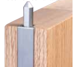
Les verrous peuvent s'ajouter à la version avec crochet ou à celle avec languette afin d'améliorer la performance de la DP