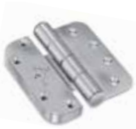
Chrome brossé PVD