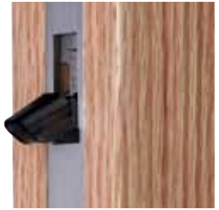
L'option avec languette s'adapte au rainures « Euro groove » de série de 16 ou 20 mm sans besoin supplémentaire de transformation extérieure