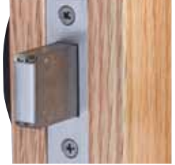
Le pêne dormant indépendant permet de sécuriser la porte sans enclencher les points de blocage éloignés