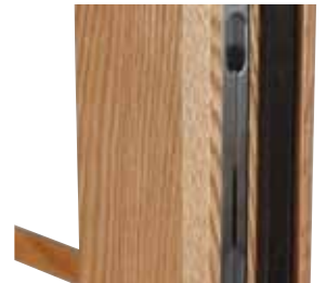
Option de verrou encastré à direction double pour les panneaux de deuxièmes vantaux