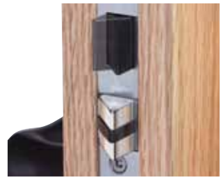
Le taquet réversible et le dispositif anti-claquement autoréglable permettent un système sans main