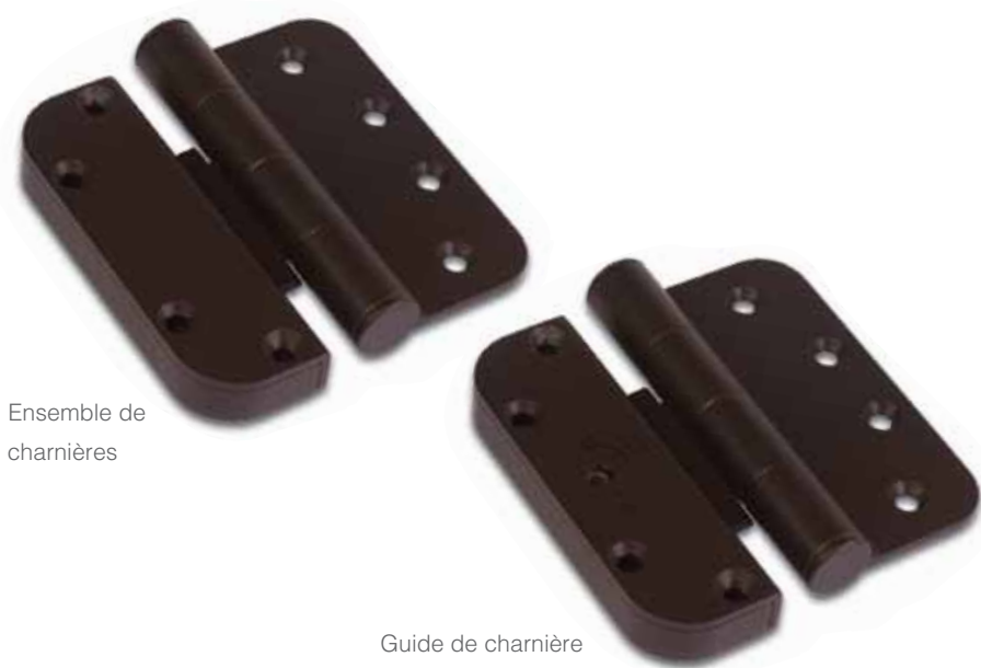
Ensemble de charnières