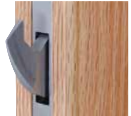
L'option avec boulon-crochet permet un verrouillage sûr